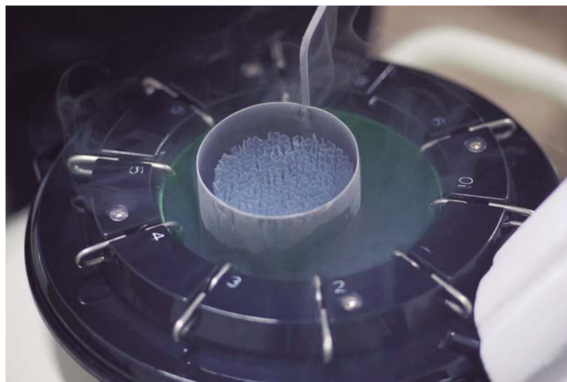
Oleg Mygovych opent een vat en haalt een verzameling van 500 rietjes van Cornet Obolensky naar boven. Verkoopprijs: 750 euro per stuk.