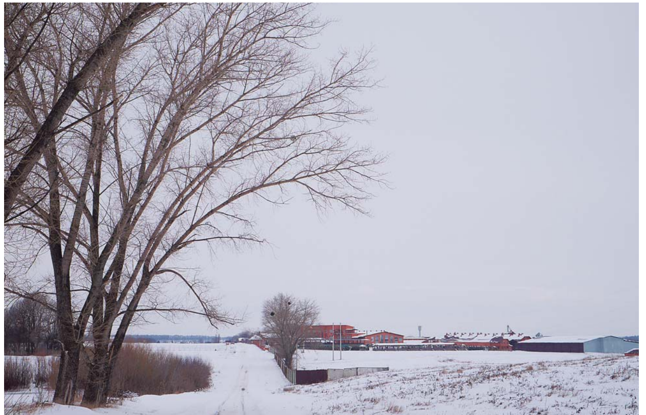
Zhashkov Stud Farm is gevestigd in Zhashkov City, zo'n 150 kilometer onder Kiev.