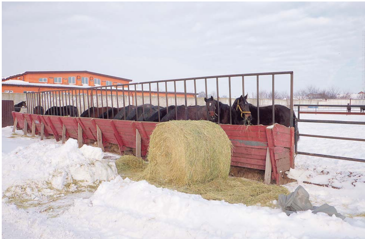
De jonge paarden van Zhaskhov Stud Farm peuzelen in de sneeuw van hun ruwvoer.

zijn effect niet gemist. Wat ook opvalt, is dat deze tweejarigen rijk in conditie zijn. Mygovych wijst op een grote schep met een kilo haver erin. “Daar krijgen ze er dagelijks drie van. We hebben buiten een silo met driehonderd ton haver. We produceren nog meer. Wat we zelf niet nodig hebben, verkopen we aan andere bedrijven.” Zelfvoorzienend zijn is ogenschijnlijk geen probleem in het land dat de graanschuur van Europa wordt genoemd. In totaal heeft de