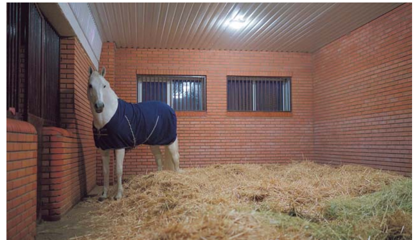
Tophengst Cornet Obolensky is de duidelijke nummer één op Zhashkov Stud Farm. Op de foto in zijn enorme box van 5 bij 12 meter.

De eerste lichte kinderen van Cornet Obolensky leverde al klinkende namen als Cornet d'Amour, Cornet's Cristallo, Cornado NRW (foto, met Marcus Ehning op de WEG in Caen), Cocoshynsky en Charlie op.