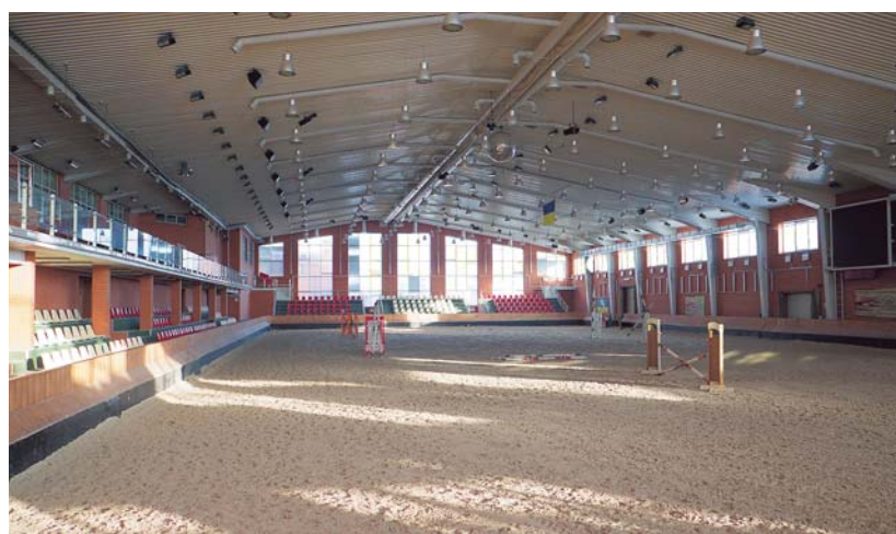
Zhaskhov Stud Farm bestaat onder meer uit een grote binnenhal met vaste tribunes en losrijhal.

Cornet Obolensky zelf is dankzij zijn opvallende nafok geliefd bij fokkers. Zijn veulens blijken nog geliefder te zijn bij kopers. Afgelopen veulenvoedingseizoen kwamen er 26 nakomelingen op zeven topveilingen in Nederland en België onder de hamer. Dit leverde een nooit eerder vertoonde gemiddelde voor de nafok van één springhengst op van ruim 24.000 euro(!). De duurste in Nederland was de in Borculo geveilde Karsten (mv. Caretano Z) voor 42.000 euro, de goedkoopste bracht nog altijd 9.000 euro op. De Cornet-gekte bereikte een absoluut hoogtepunt op de Z Quality Auction. Voor Cape Verde Kreisker Z (mv. Quidam de Revel) werd liefst 62.000 euro neergeteld. De teller voor de in totaal tien geveilde Cornet-veulens liep in Lanaken op naar een recordgemiddelde van 34.600 euro.